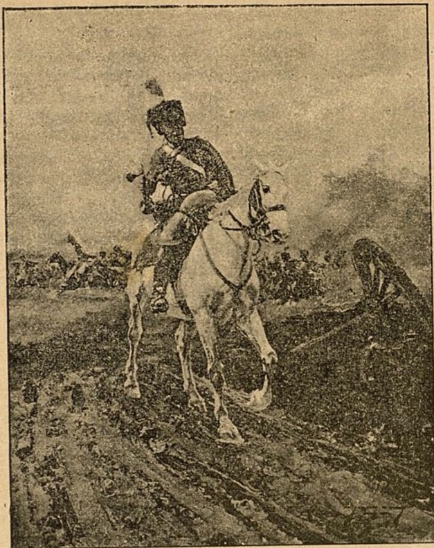
CUADRO DEL NOTABLE PINTOR MARCELINO DE UNCETA.

Sin el auxilio de balancín ni de paraguas, se mantiene en equilibrio sobre el alambre, adoptando actitudes y posiciones increíbles á no ser vistas.