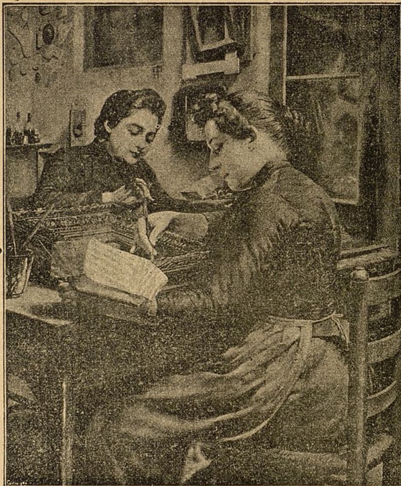
DORADORAS (CUADRO DE DON MANUEL CUSI.)