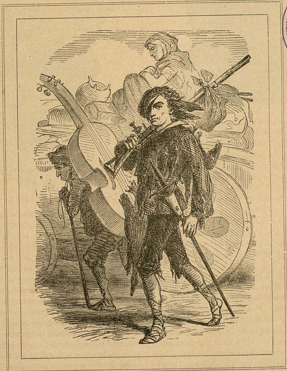
CÓMICOS DE ANTAÑO.

Se publica los días 10, 20 y 30 de cada mes.