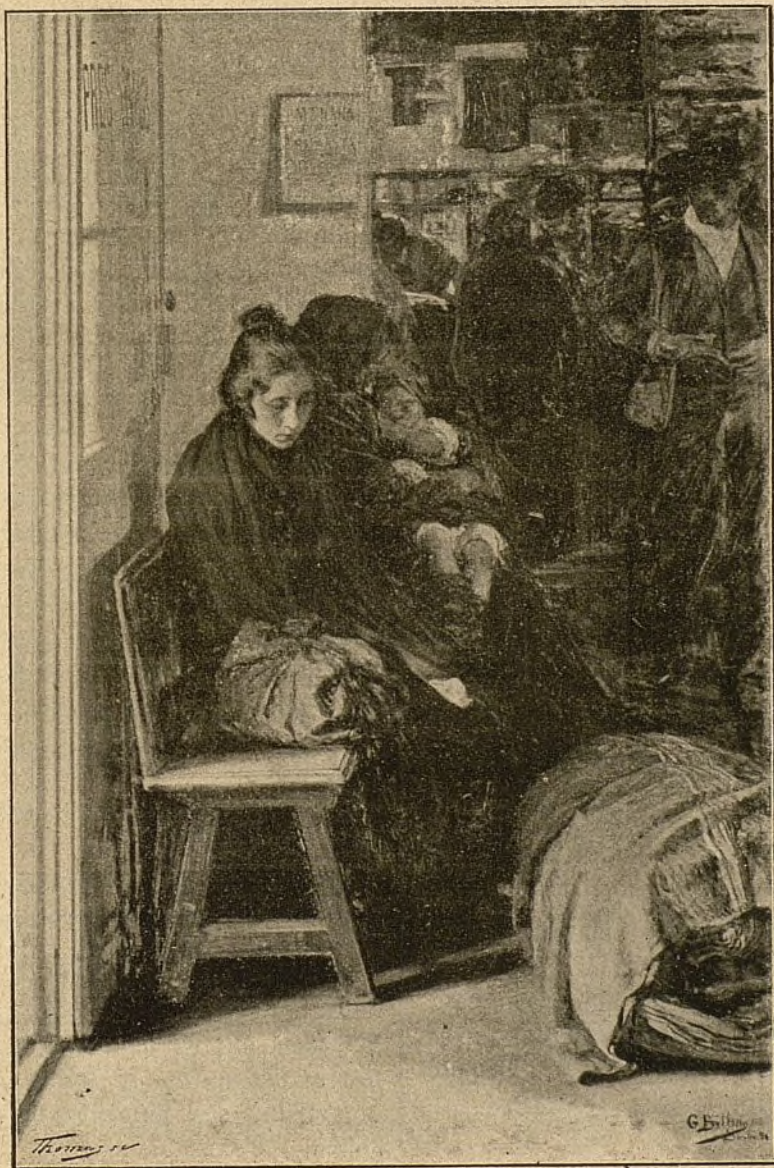
TRISTE ANTESALA, CUADRO DE BILBAO.