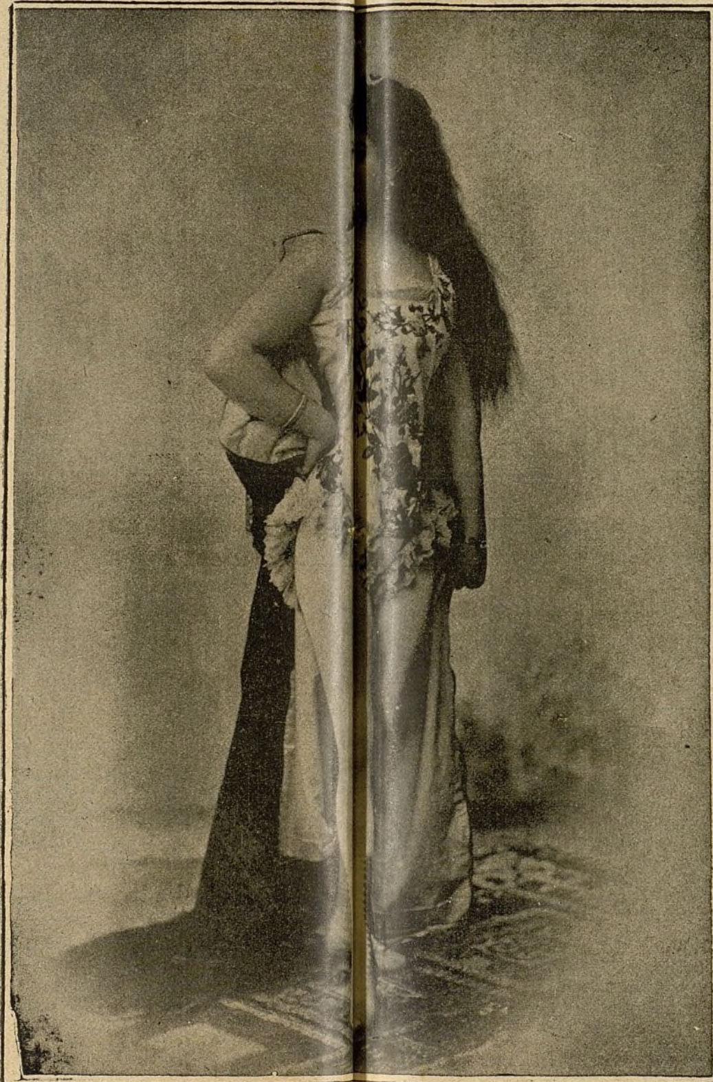
Con la TOILETTE que usa en el trabajo del Trapecio Oscilante.