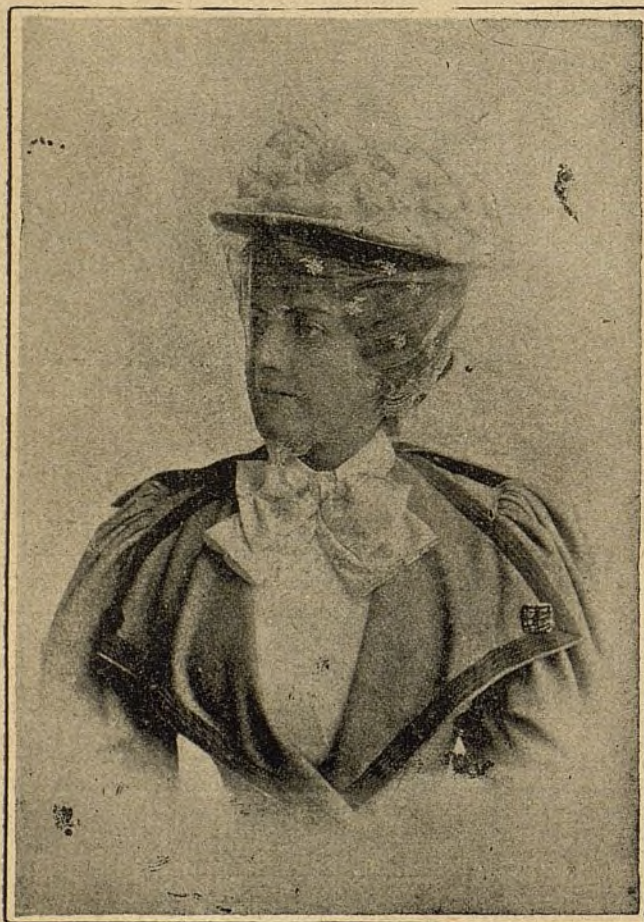
En traje de calle.