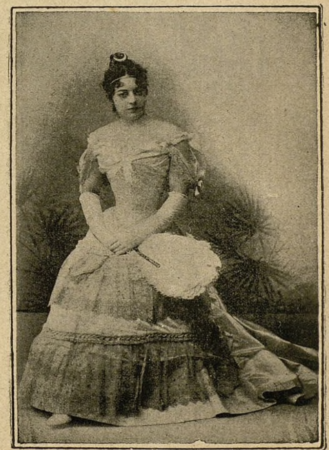
En traje de sociedad.