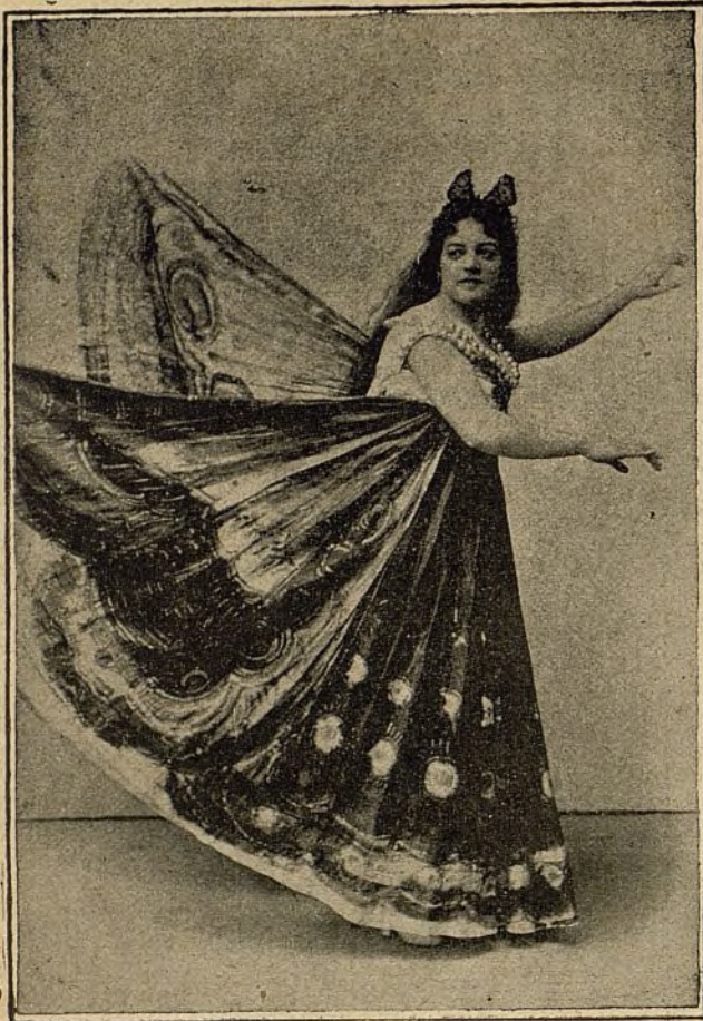
En el baile LA MARIPOSA.