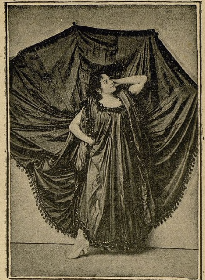
En el baile LA MACARENA.