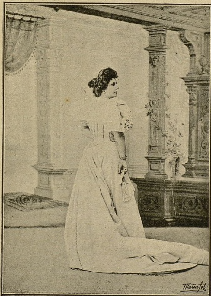
ELENA FONSDÉCHECA SOPRANO DRAMÁTICA DEL TEATRO REAL.

Se publica los días 10, 20 y 30 de cada mes.