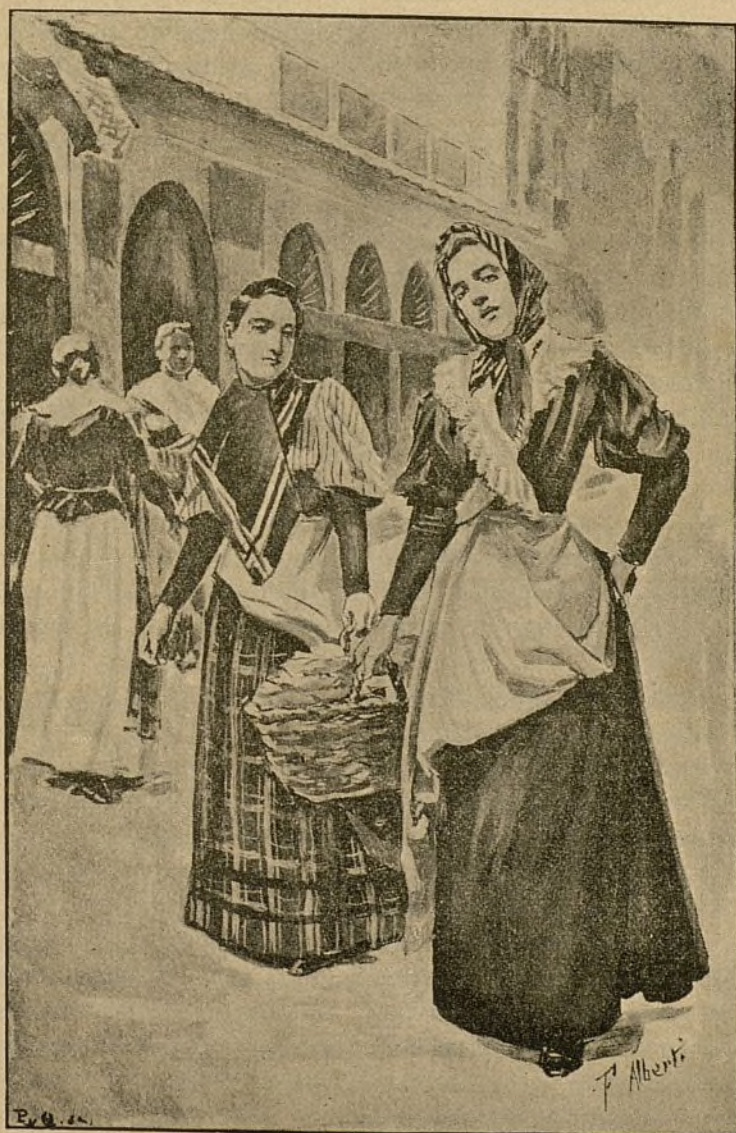
VENDEDORAS, POR F. ALBERTI.