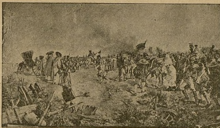
CUADRO DEL PINTOR GADITANO SR. FERNÁNDEZ DE LA MOTA.

ció por su gracia, por su chic , por su belleza, por su finura de acción, y en fin, por su no sé qué inimitable.