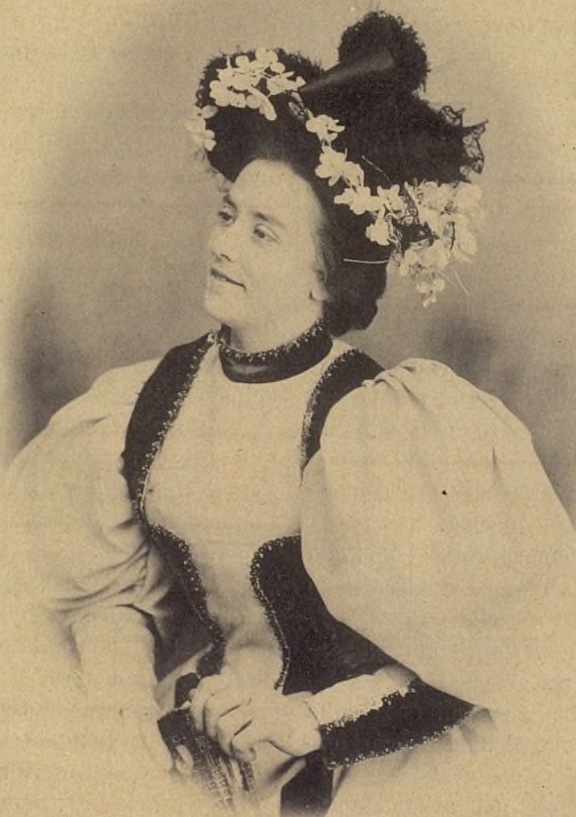
BLANCA MATRÁS TIPLE CÓMICA DE ZARZUELA.