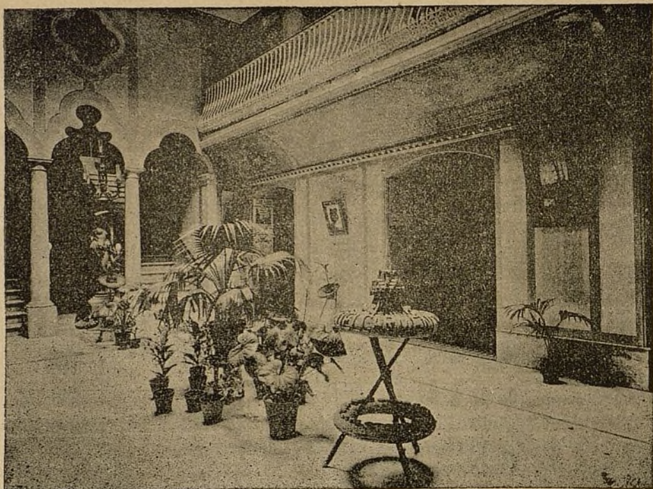
Patio principal de entrada del Palacio de la Exposición, con las Instalaciones de Plantas y Flores, en el centro, y la de la Fábrica de Corchos de «Nuestra Señora del Carmen» de Puerto Real, en el primer término.