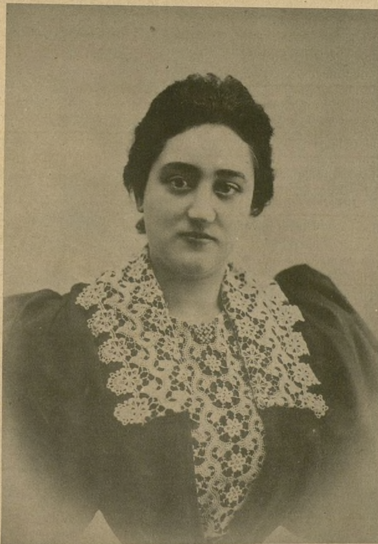
MATILDE PRETEL CÉLEBRE TIPLE DE ZARZUELA.