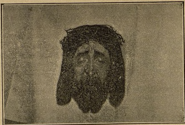
LA SANTA FAZ, PINTURA DE D. A. GASCÓN DE GOTOR.

ner una conferencia con el aludido hombre público, y viendo ya perdidos sus deseos, lo esperó á la puerta de su despacho, pidiéndole con nuevas instancias una entrevista.