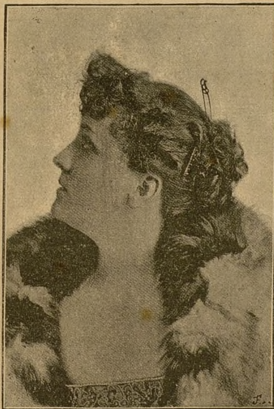
CABEZA DE ESTUDIO.

Se publica los días 10, 20 y 30 de cada mes.