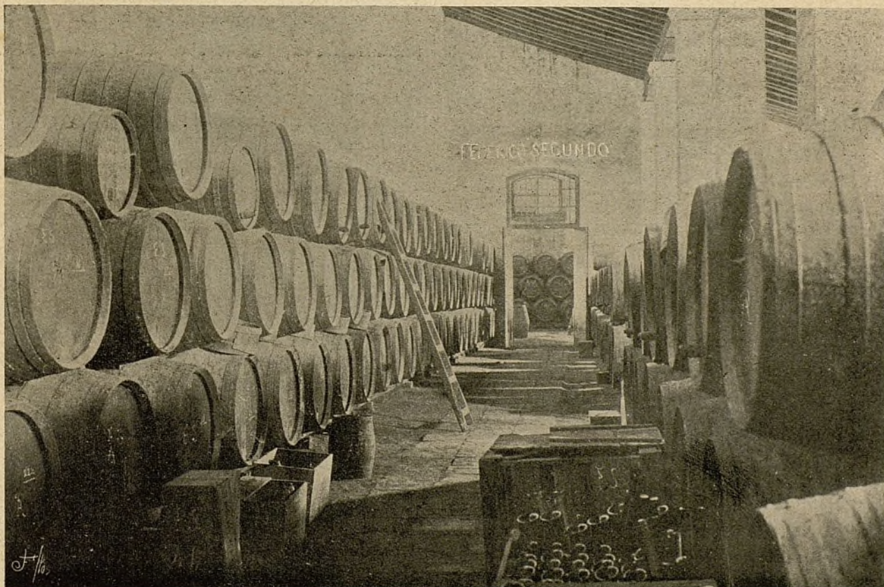
Vista de una de las Bodegas de FEDERICO SEGUNDO en el Puerto de Santa María.