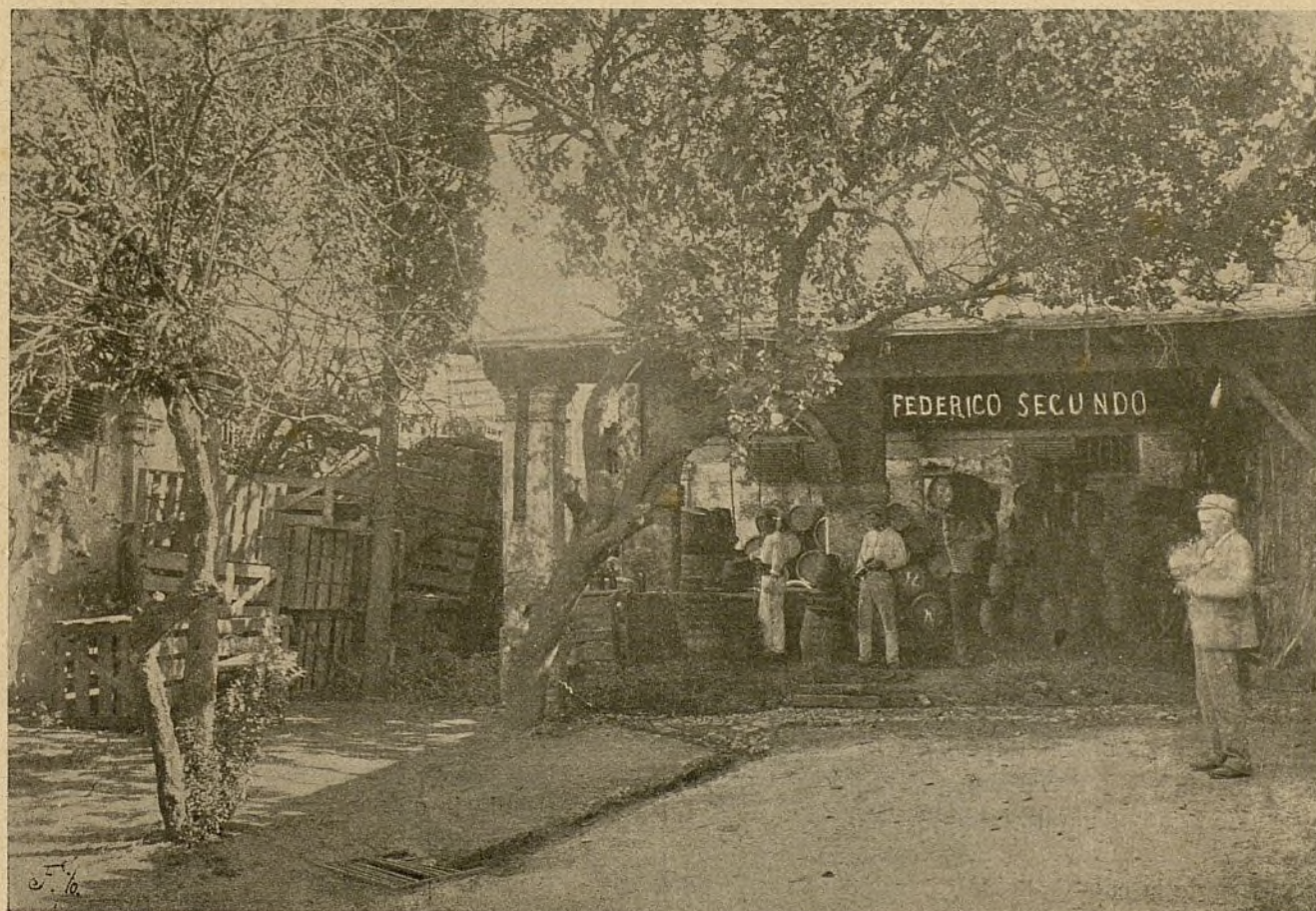
Patio de las bodegas de la casa FEDERICO SEGUNDO, en el Puerto de Santa María.