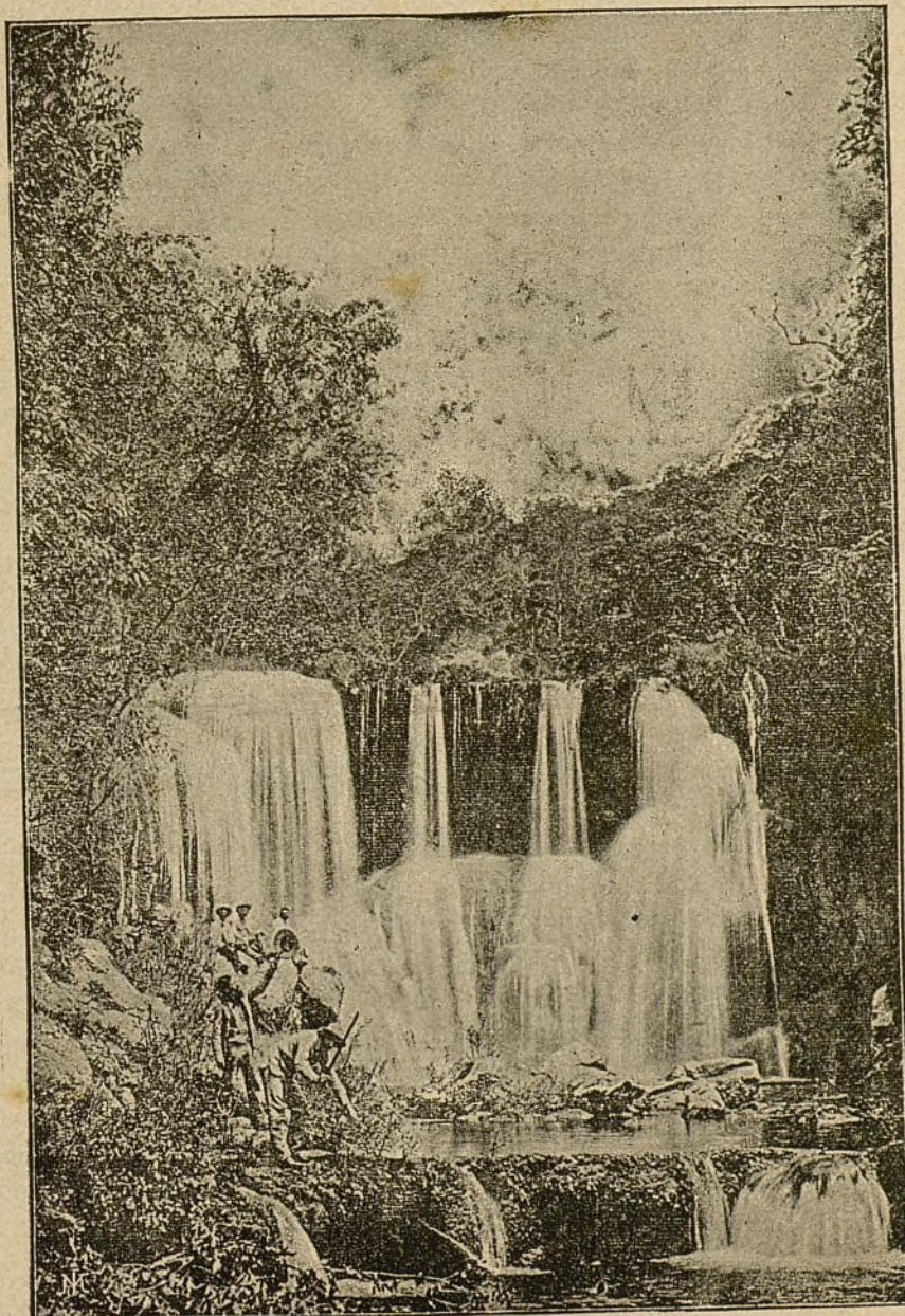
ISLA DE CUBA.—LA CASCADA DE ARGAMINIA.