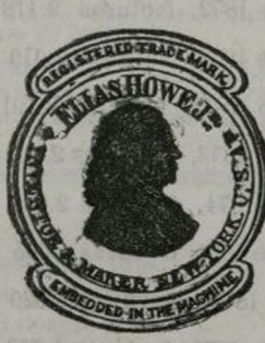
de NUEVA- YORK.

La máquina WHEELER & WILSON, sin lanzadera y con aguja recta, única en su clase, ha sido nombrada La maravilla de la Exposición de Filadelfia , con premio único especial, dos medallas de mérito y dos diplomas de honor por sus trabajos en paño, cuero y tela fina.