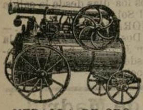
MEDALLA DE ORO Exposicion 1878, clase 52.

MÁQUINA HORIZONTAL locomotora ó sobre patines Caldera á llama directa de 3 á 50 caballos.