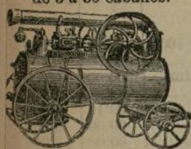
MEDALLA DE ORO Exposición 1878, clase 52.

MAQUINA HORIZONTAL comovible ó sobre patines Caldera á llama directa de 3 á 50 caballos.