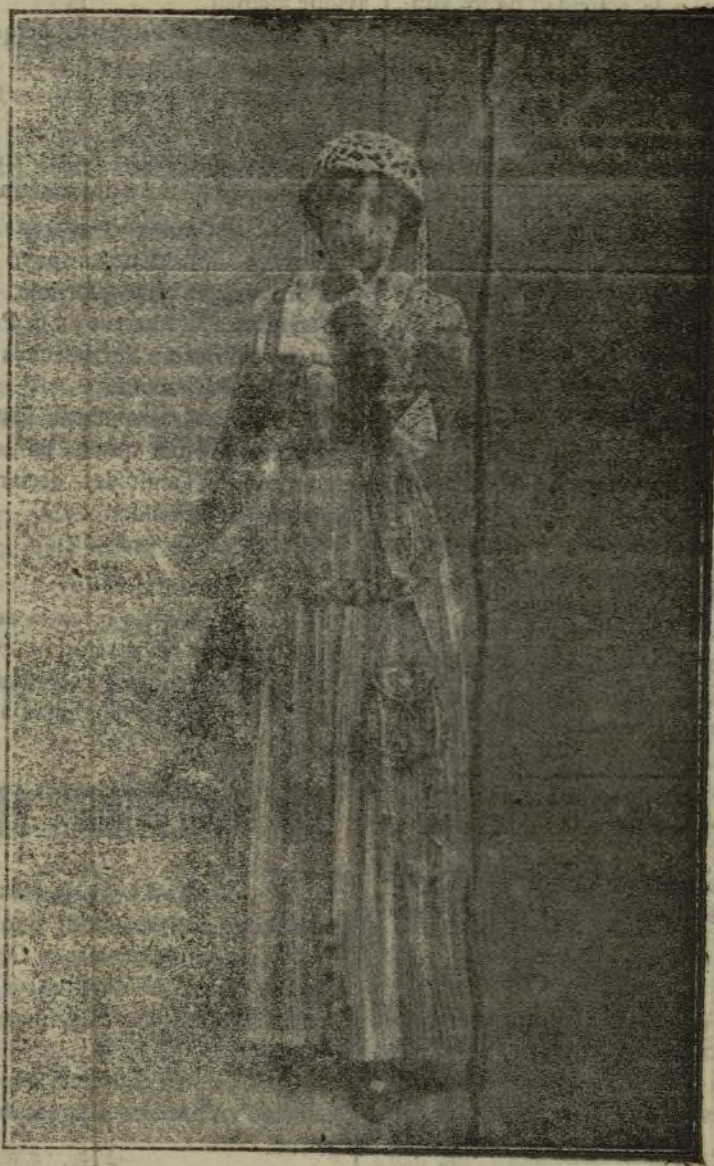
La eminente diva señora Amelita Galli-Curci, ídolo del público madrileño, que ayer tarde interpretó en el Real la ópera de Verdi Traviata , obteniendo un ruidoso éxito.