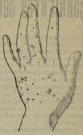
Mano que no se lava con este jabón.