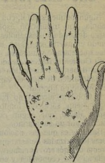
Mano que no se lava con este jabón.