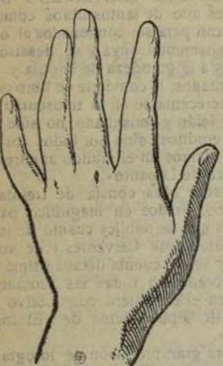
Mano que se lava con este jabón.