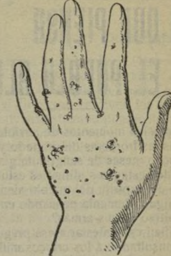
Mano que no se lava con este jabón.