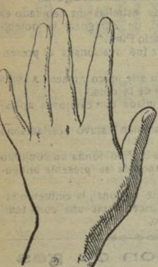
Mano que se lava con este jabón.