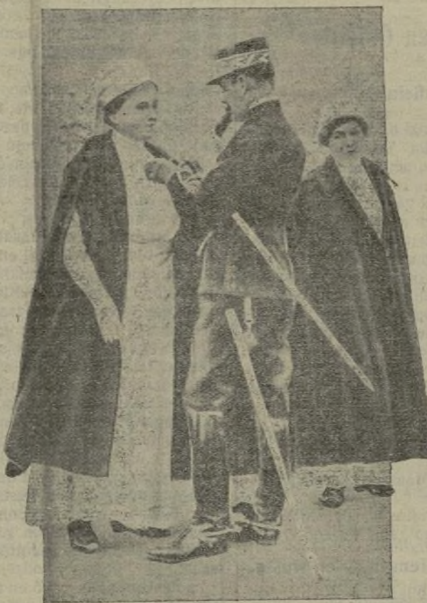
Enfermera francesa condecorada en el campo de batalla.