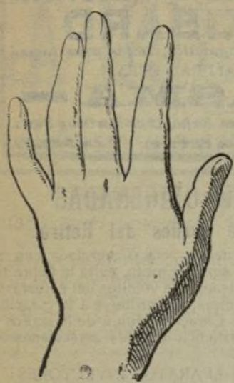
Mano que se lava con este jabón.