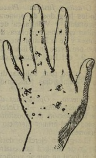
Mano que no se lava con este jabón.