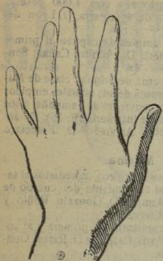
Mano que se lava con este jabón.