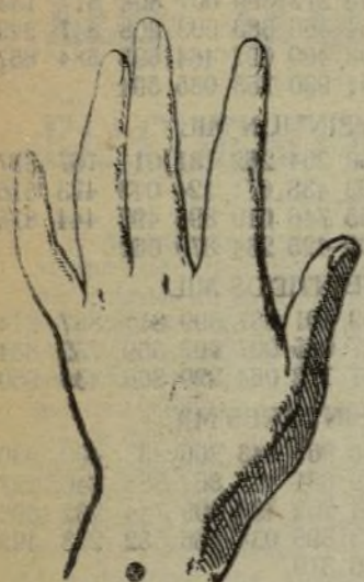
Mano que se lava con este jabón.