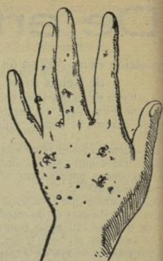
Mano que no se lava con este jabón.