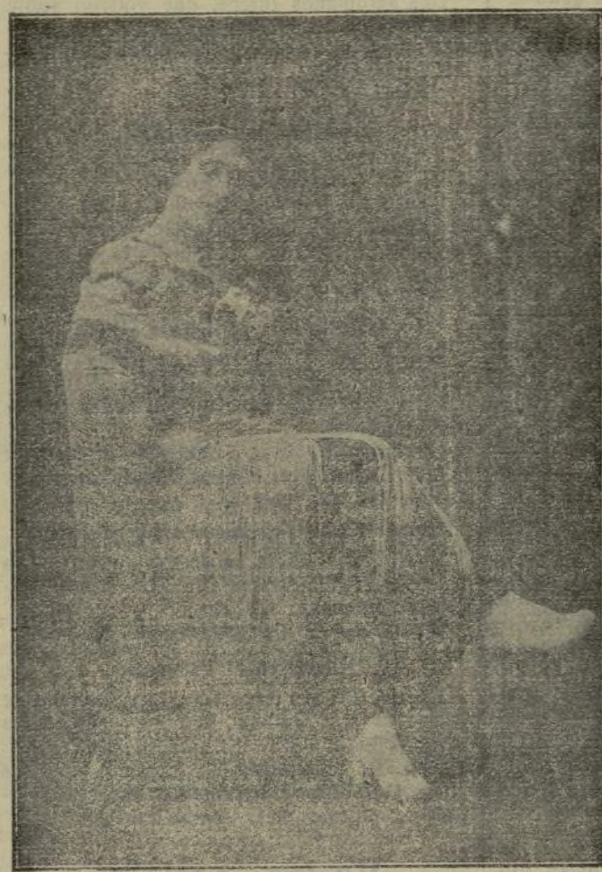
Carmen la Cosmopolita.

El último gesto D'Annunzio ha sido decir que sólo abandonará Francia y pondrá los pies en Italia cuando sea decretada la movilización.