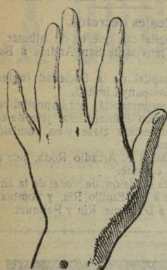
Mano que se lava con este jabón.