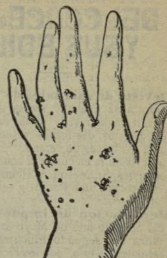
Mano que no se lava con este jabón.