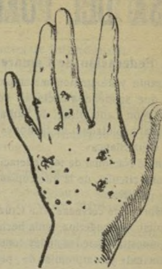
Mano que no se lava con este jabón.