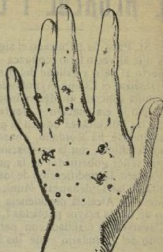
Mano que no se lava con este jabón.