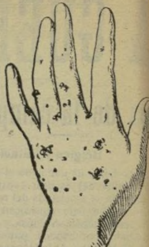
Mano que no se lava con este jabón.