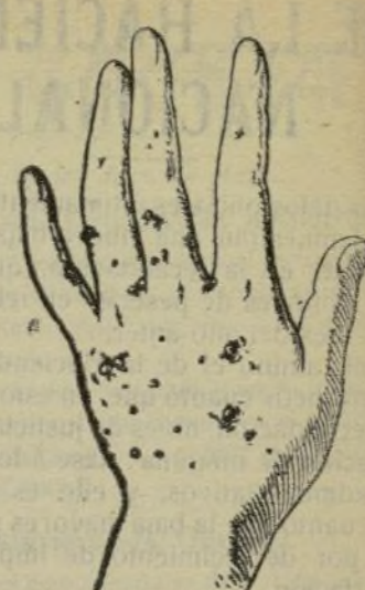
Mano que no se lava con este jabón.