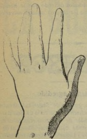
Mano que se lava con este jabón.