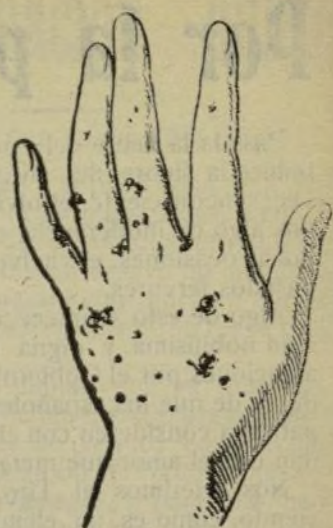
Mano que no se lava con este jabón.