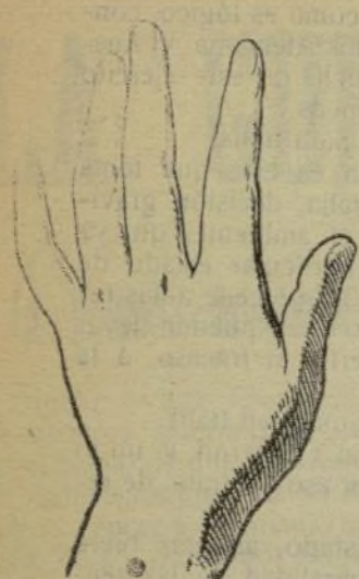
Mano que se lava con este jabón.