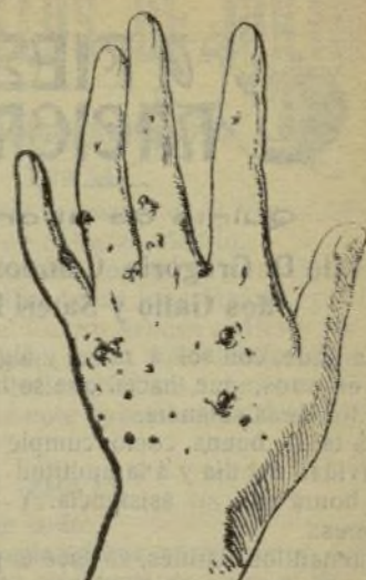
Mano que no se lava con este jabón.