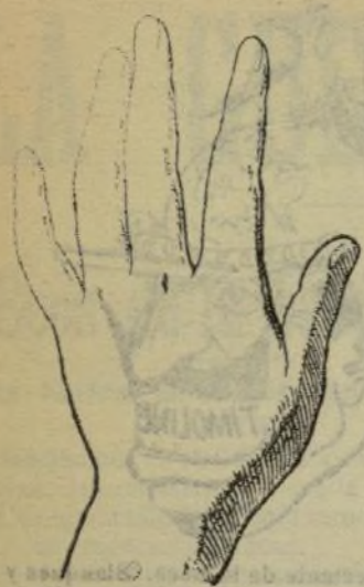
Mano que se lava con este jabón.