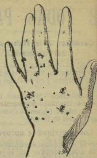
Mano que no con este jabón.