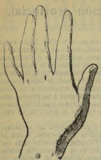
Mano que se lava con este jabón.