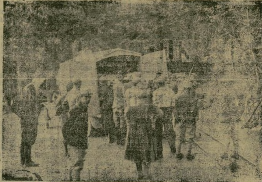
Llegada de un camión automóvil conduciendo provisiones de boca a una de las trincheras del frente francés.

Al público madrileño no le gustó en totalidad la nueva obra. Quizás su técnica, algo antigua, vacuada en moldes de un teatro pasado de moda, tal vez la excesiva ingenuidad de sus escenas o el candor de una fábula inocente; puede ser que la inconsistencia de unos personajes cuyas psicologías quedaron algo borrosas y cuyos caracteres se enmohecieron en el transcurso del drama por excesiva frialdad; acaso la falta de naturalidad ó la sobre de pas-