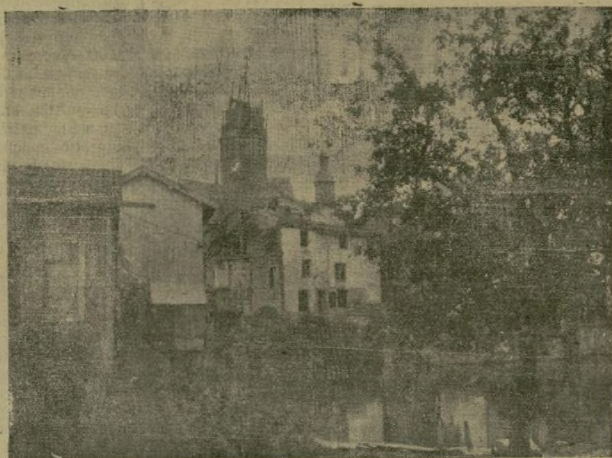
La ciudad de Berane en la frontera montegrina, una de las primeras pobla- ciones que han caído en poder de las tropas austroalemanas.