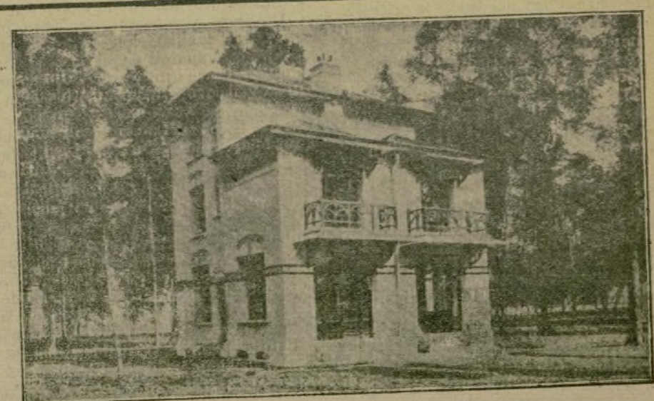
ESCUTARI.—Casa donde se estableció el Estado Mayor servio.

Deber es de todos secundar esta obra de l gobernador, encaminada á extirpar esta ver- tiente de Madrid.