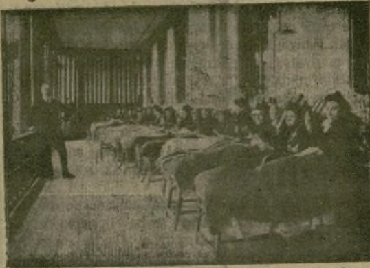
FRANCIA.—Un Hospital de heridos

En la tribuna pública del Ayuntamiento no se permitirá pasar sino después de los cacheos rigurosos. Los ordenanzas de los concejales, que son guardias municipales, no podrán entrar en el Ayuntamiento si no van vestidos de uniforme.