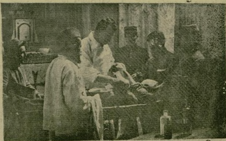
Ambulancia militar, instalada en una iglesia.