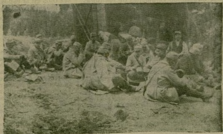
Columna austriaca comiendo el rancho durante un descanso en la marcha.

Pero los maestros se van. ¿Cómo no experimentar una honda tristeza? Ellos nos hicieron románticos y sentimentales. Al verlos marchar, queremos decirles cariñosamente adiós. Toda nuestra juventud se agolpa en el recuerdo; los bellos é inolvidables tiempos escolares; las solemnes aperturas de curso y los apuros de los exámenes; las riñas y las sonrisas; los gritos y las carreras en los días de revuelta; el aula en que explicaba Clarín y el patio de la Universidad en que nuestros compañeros nos encaramaban sobre sus hombros para que excitásemos y soliviantáramos a los camaradas, y el altar sagrado de la cultura desde el que por vez primera se nos brindó, como la finalidad más alta de nuestra vida, el noble y generoso sacrificio por la patria.