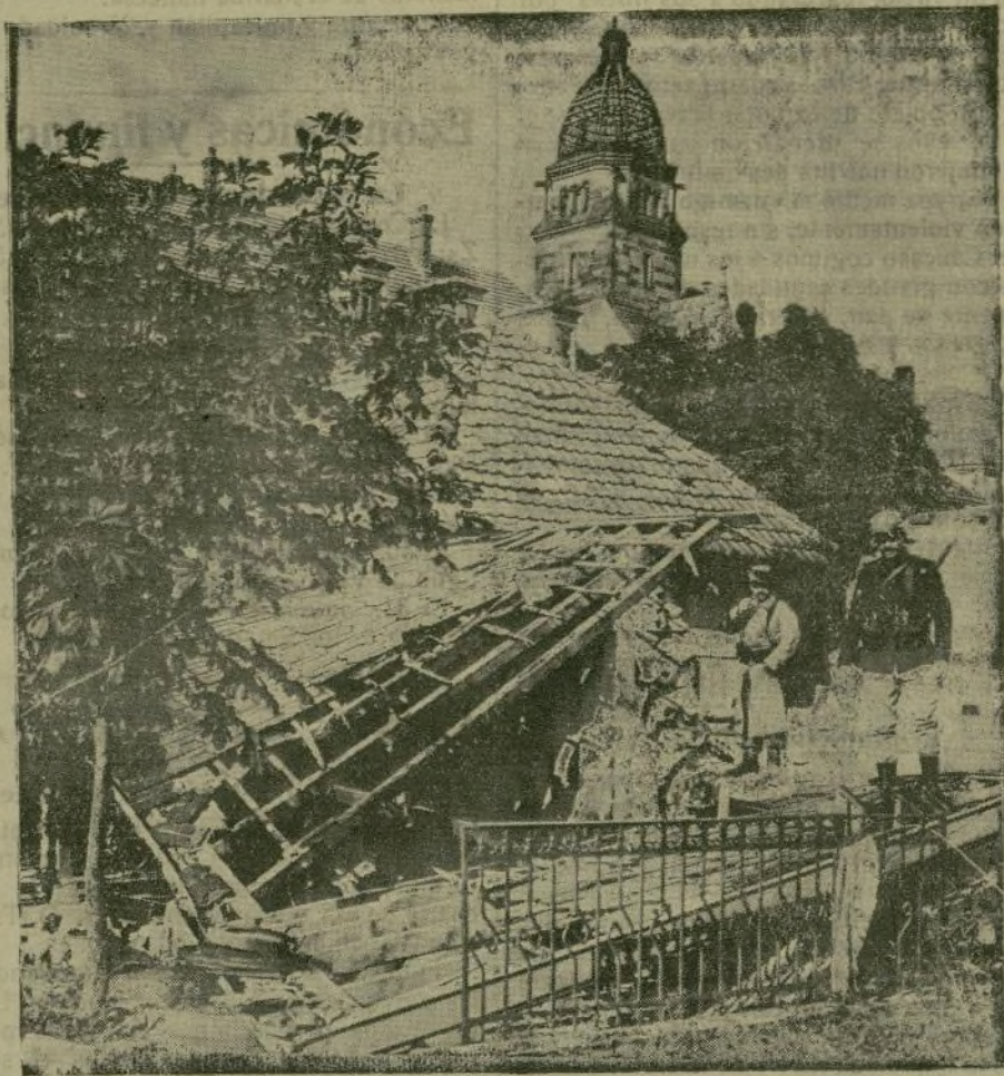
Centinelas austriacos en los alrededores de Cetina.

«No es porque una minoría de socialistas democráticos busque actualmente reacciones contra una política de crímenes y de espoliaciones, que debe olvidarse la pesada parte asumida por el conjunto del Partido social democrático en esta guerra de agresión y de conquista.