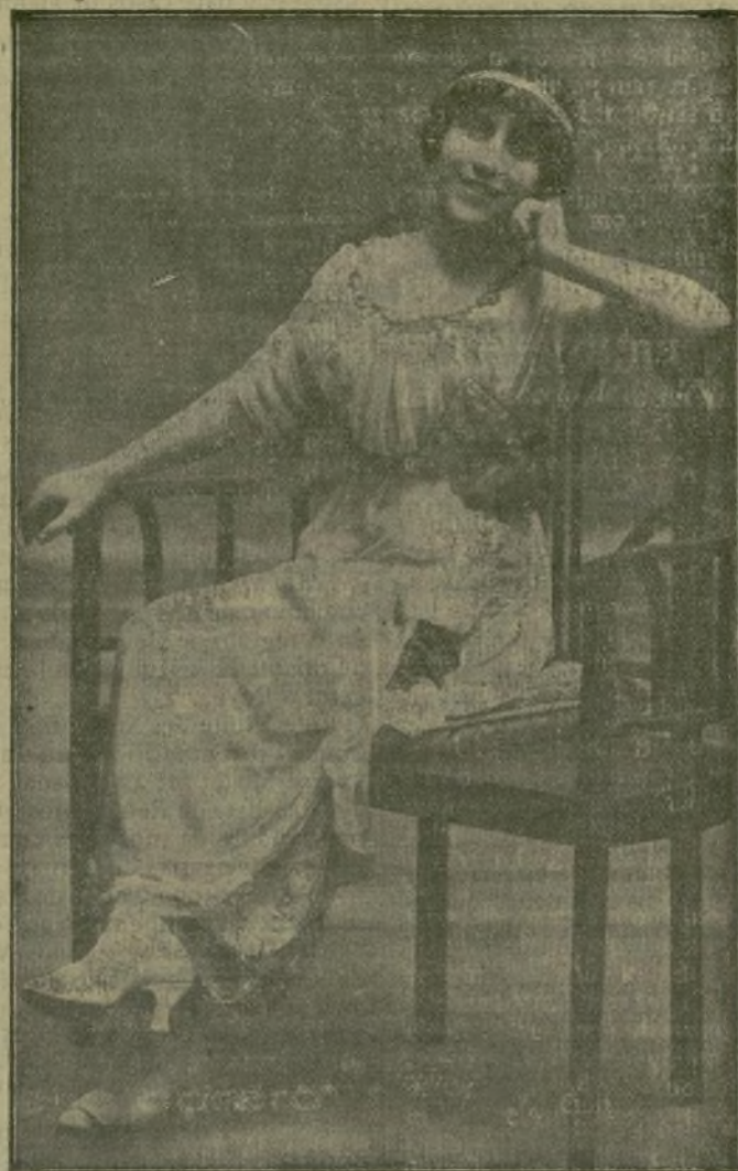
Favorita, estupenda cancionista que después de hacer una brillante tournée por Cataluña, ha hecho su reaparición el teatro de Romea, donde todas las noches obtiene muchos y merecidos aplausos.