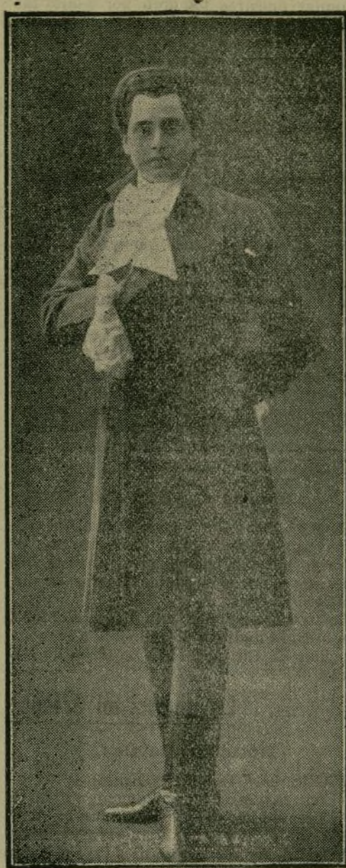
El insigne tenor Anselmi en la ópera «Tosca», una de sus favoritas.

Dado en Palacio a veinticinco de Febrero de mil novecientos dieciséis. —ALFONSO.— El presidente del Consejo de Ministros, ALVARO FIGUEROA.