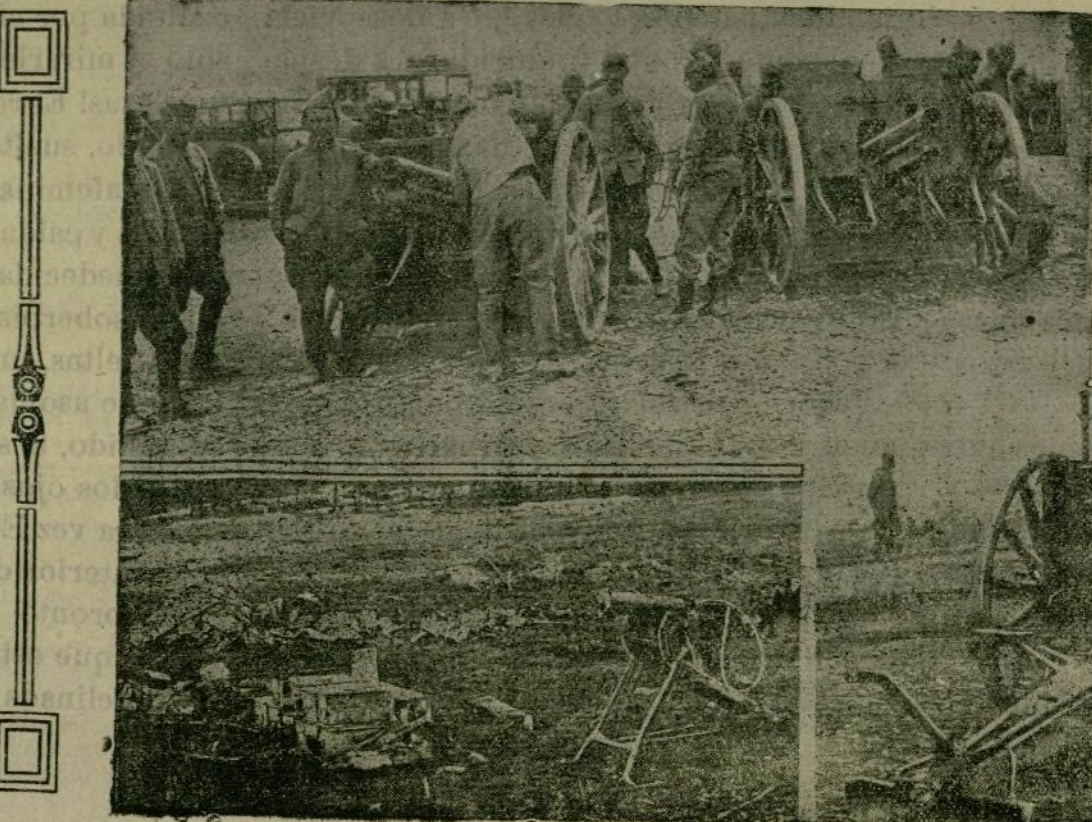
Escenas de la guerra.