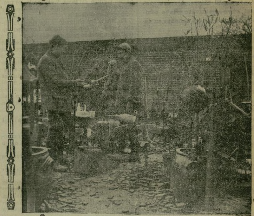
Escenas de la guerra.—Un taller de armero improvisado.

También ha de procurarse que, cuando la clase de trabajo lo exija, sobre todo en las Artes del Libro, la luz que recitan los locales sea, además de lateral, cenital, por medio de tragaluces o claraboyas grandes y extensas; en la iluminación nocturna se huirá de las de petróleo, bujías y, sobre