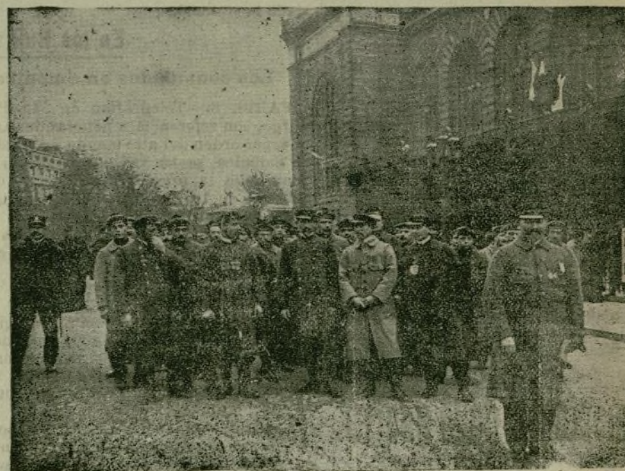
Escenas de la guerra.—Oficiales y soldados franceses, convalecientes de las heridas que recibieron en el frente, dirigiéndose a por sus pasaportes para volver a sus respectivos regimientos.

Y es como una absolución plena y fraternal, como un sonriente perdón el hallazgo de esta nave antigua que fiz su camino de esperanza , por las estrofas clásicas de un poeta del siglo xv.