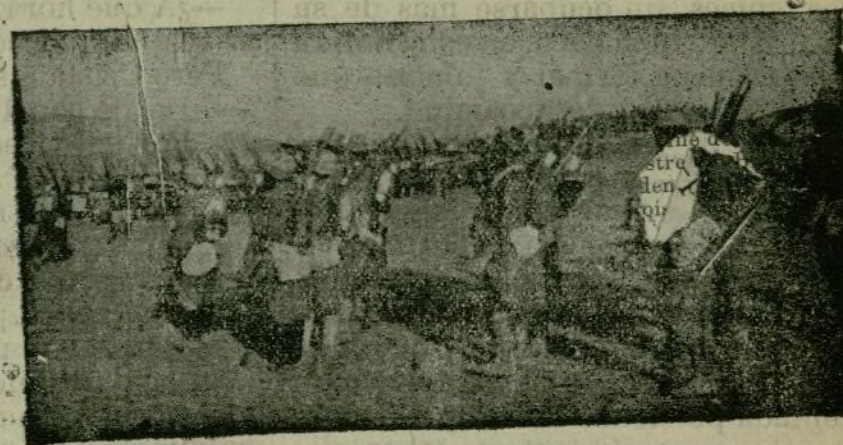
Escenas de la guerra.—General alemán revistando una brigada turca.