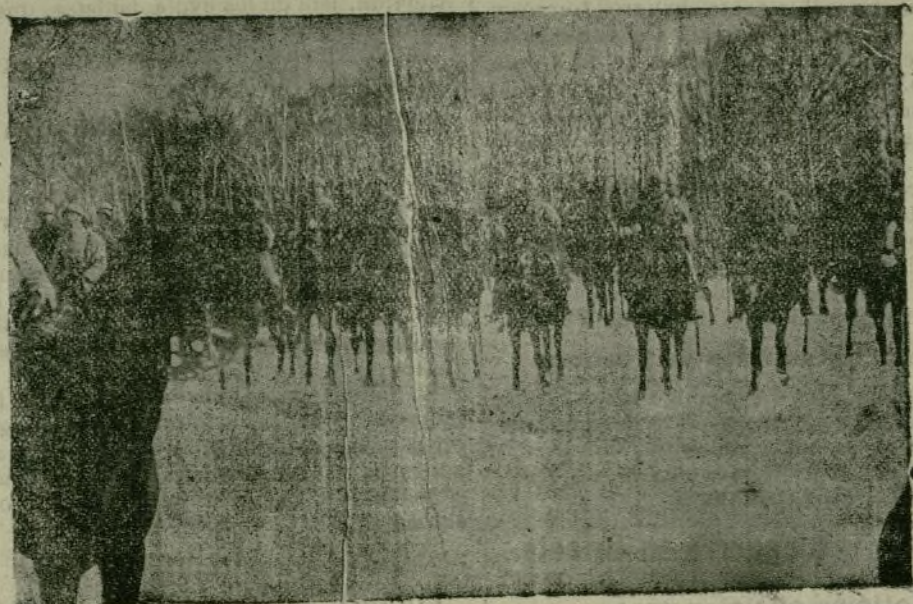
ESCENAS DE LA GUERRA

Esta negativa pone en un gran aprieto a nuestros labradores, que si quieren seguir adquiriendo tal artículo habrán de traerlo de los Estados Unidos. Pero como el sulfato de cobre de los Estados Unidos resulta aquí, en España, a un precio tan elevado que su empleo no se hace remunerador para los agricultores resulta que la negativa de Inglaterra vale tanto como privar a España de la posible importación de tal materia.