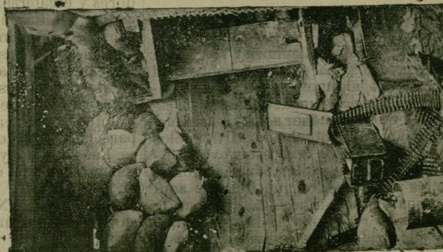
ESCENAS DE LA GUERRA

Enhorabuena a la nueva Empresa, a quien deseamos muchas prosperidades.